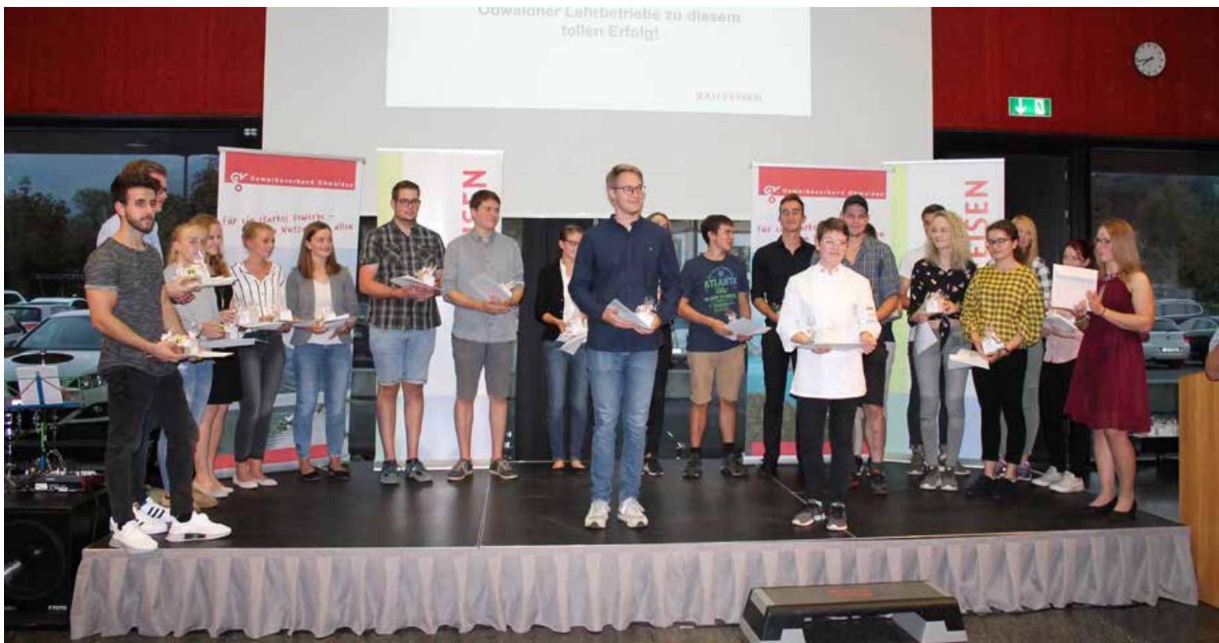
Die erfolgreichen Lernenden stellten sich zusammen mit den Swiss-Skills 2018 Teilnehmenden auf die Bühne.