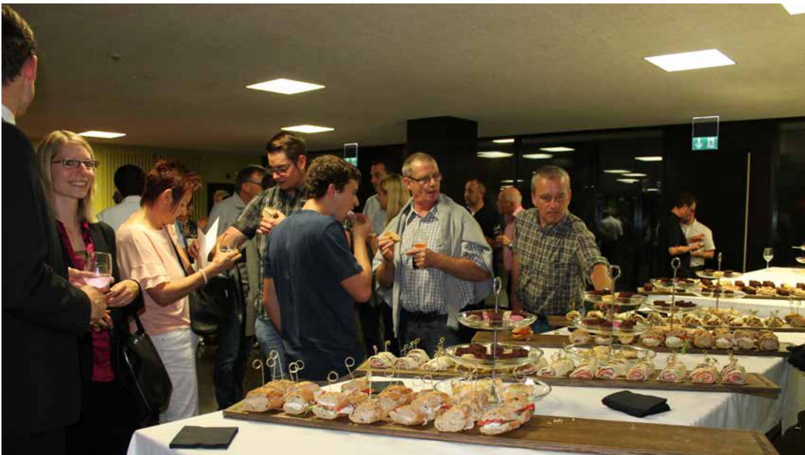
Mit einem Apero und interessanten Gesprächen liessen die Teilnehmenden den Abend ausklingen.