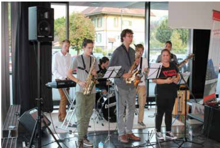
Begleiteten den Herbstanlass musikalisch: Die Metro Monkeys.