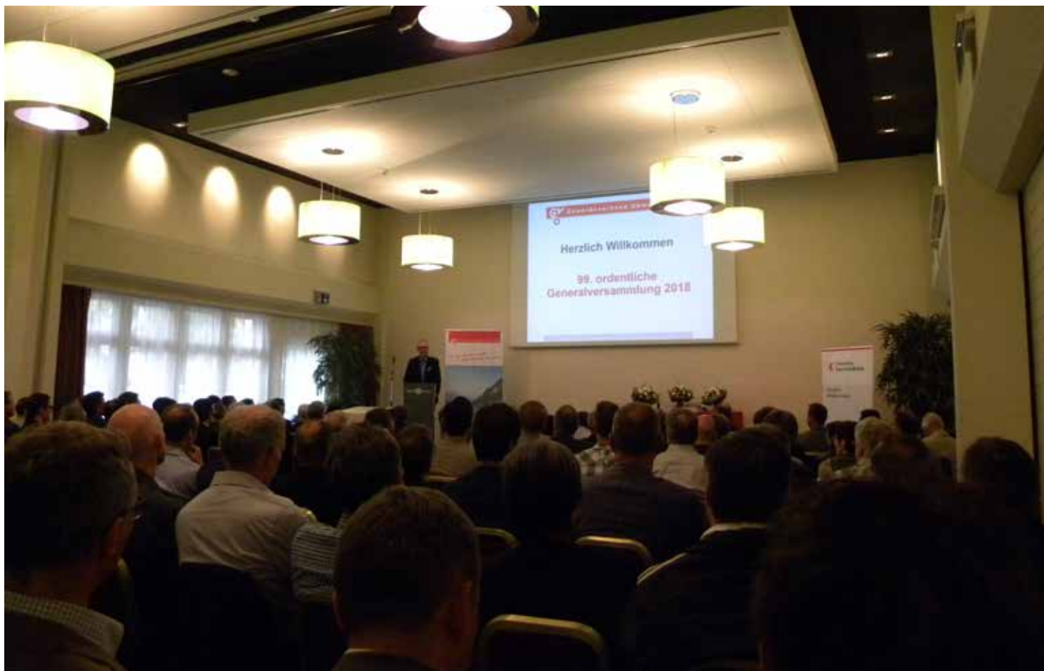
Generalversammlung des Gewerbeverband Obwalden 2018

Zum Schluss der Generalversammlung informierte der Vorstand die Mitglieder über die diversen Veranstaltungen, die in den Jahren 2019 und 2020 anlässlich des 100 jährigen Jubiläums vom Gewerbeverband Obwalden geplant sind.