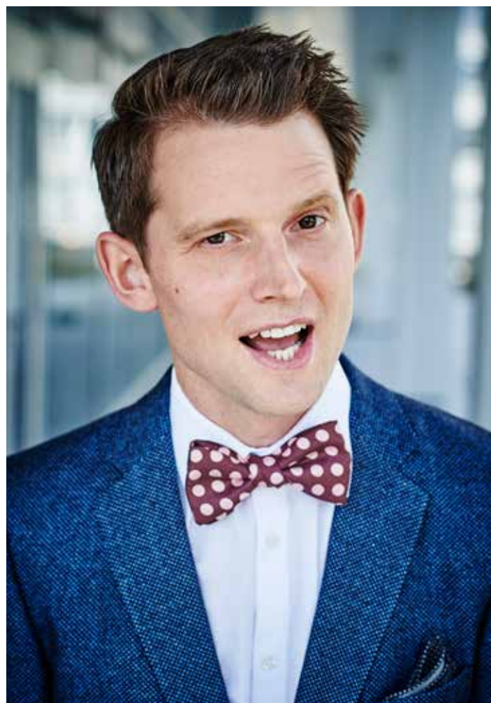
Wird das Publikum am Herbstanlass unterhalten: Der Komiker und Parodist Fabian Unteregger.

Nach einer kurzen Sommerpause wird am 26. August in Alpnach der Herbstanlass stattfinden. Wie jedes Jahr werden die erfolgreichsten Lehrabschlüsse in Obwaldner Betrieben geehrt. Umrahmt wird der Anlass von dem aus Radio und Fernsehen bestens bekannten Parodisten und Comedian Fabian Unteregger.