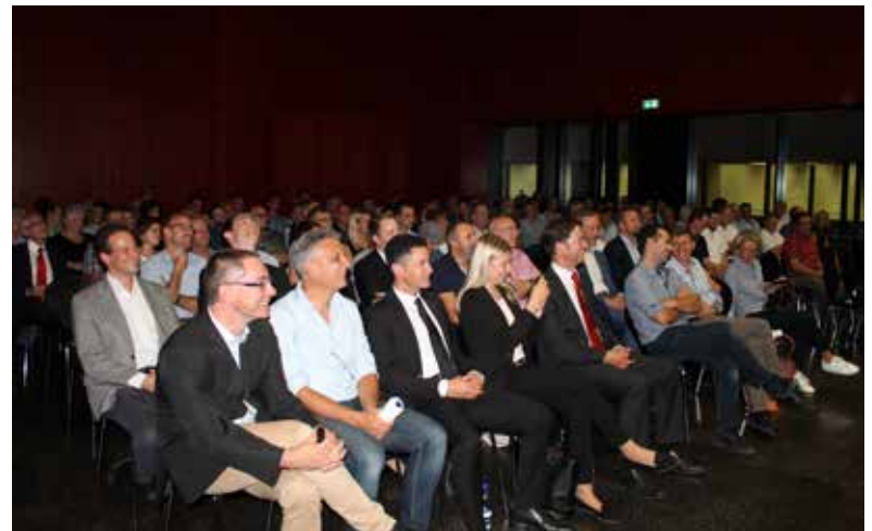
Knapp 130 Personen waren in der Aula der Kantonsschule Obwalden in Sarnen anwesend.