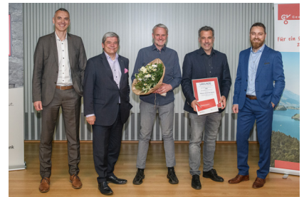
Gewinner Wertschätzungspreis Portmann Garten AG