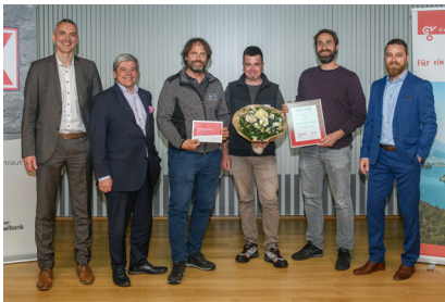
Gewinner Wertschätzungspreis Von Rotz & Wiedemar AG