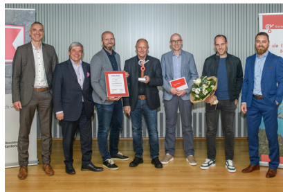
Gewinner Anerkennungspreis Iromet AG